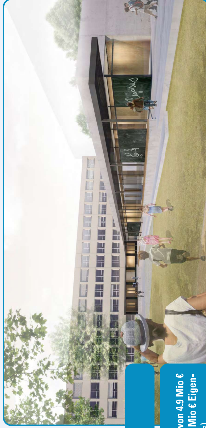
© Isfort & Isfort Dorn und Buchner + Wehne architekten