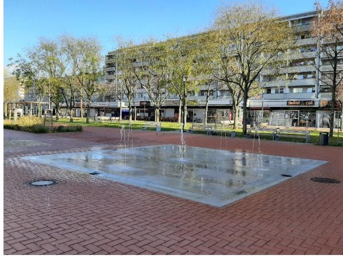
Das Fontänenfeld in der Ladenpassage"

Auf die Erfrischung durch Wasser hat man sich im Sommer bereits gefreut. Von außen betrachtet schien auch alles fertig zu sein, aber so ganz war das nicht der Fall. Denn bei der Lieferung von einem nötigen Schaltschrank gab es Verzögerungen und so konnte das Wasserspiel nicht in der warmen Jahreszeit eingeweiht werden.