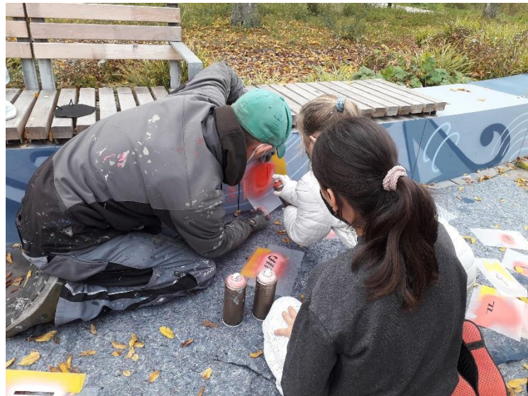
Graffiti Workshop an den Betonbänken an der Venusstraße

Die Kinder hatten viel Spaß und auch der Graffiti Künstler war schwer beeindruckt vom Talent des möglichen Nachwuchses, der über mehrere Stunden fleißig an der Gestaltung mitgewirkt hat. Das Projekt wurde über den Aktionsfonds Kosmosviertel finanziert.