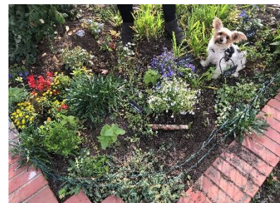
Die „Hochbeet-Gruppe“ an den Beeten in der Ladenpassage (2020–2021) (Bild 2: © Joachim Schmidt)